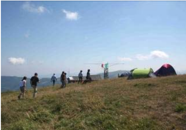
Arrivo di uno dei tanti gruppi di camminatori

Il meteo non è stato sempre favorevole ma osservare dall'alto la formazione dei temporali che venerdì si sono abbattuti sulla pianura è stato comunque uno spettacolo.