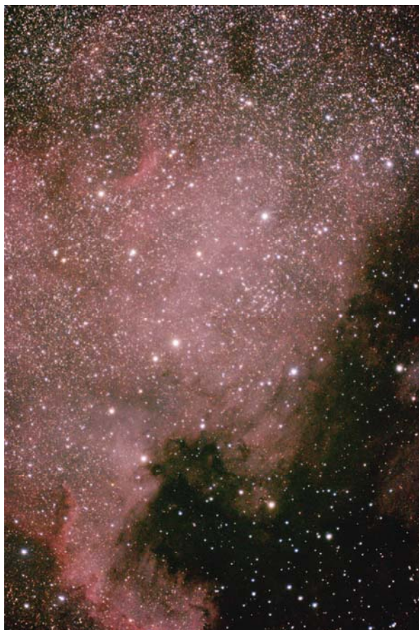
Nebulosa NGC 7000

Nell'osservazione ad occhio nudo l'oggetto più luminoso della serata è stato il pianeta Giove, mentre quello più lontano la galassia di Andromeda: oltre 2 milioni di anni luce.