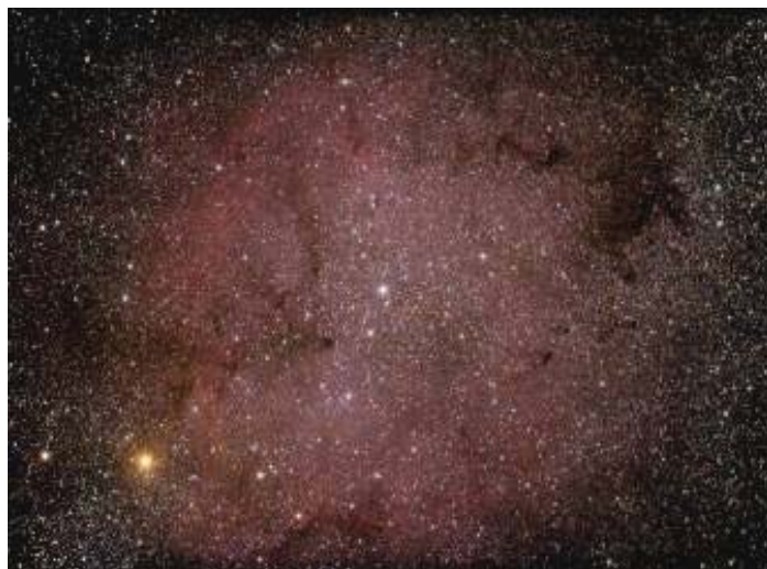
Nebulosa IC 1396

La sessione osservativa è durata fino alle prime luci dell'alba, vista solo da pochi irriducibili; tra questi si sono contati anche astrofili non appartenenti al Gruppo Astrofili Lomellini ma il senso di "appartenenza" davanti ad un simile spettacolo perde di ogni significato.