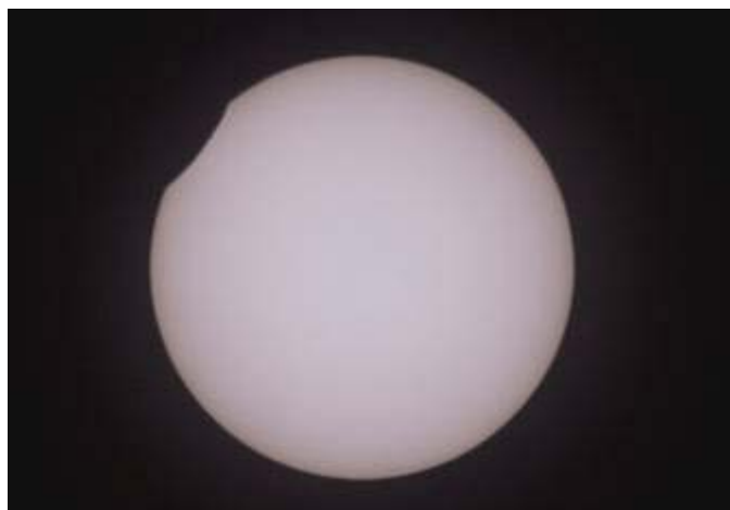
Eclisse [molto] parziale di sole