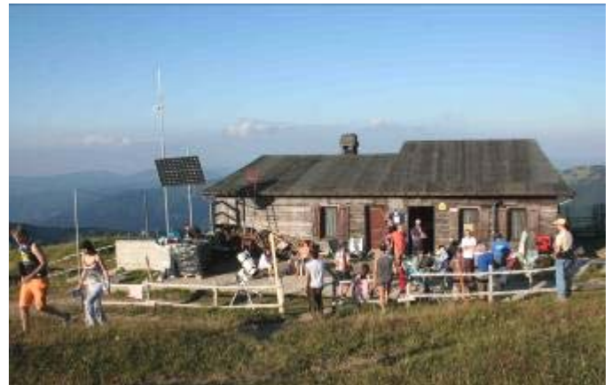
Attività di osservazioni diurne