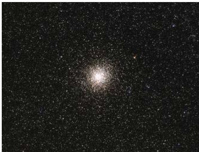
Ammasso M22

Con l'osservazione strumentale un'infinità di ammassi e galassie si rivelavano ad ogni puntamento dei telescopi concedendo dettagli impossibili da osservare anche solo da quote collinari.