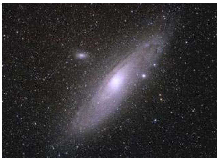
Galassia di Andromeda