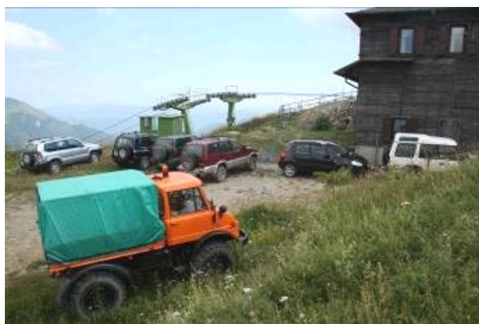
Parco automezzi navetta

Ma lassù c'era un cielo di rara trasparenza ed il Sole che ci ha regalato un'eclisse parziale; dunque, per garantire a tutti di godersi lo spettacolo, è stato istituito un servizio di navetta con i fuoristrada, anche se, inaspettatamente, sono stati moltissimi a voler salire con le proprie gambe approfittando della frescura d'alta quota.