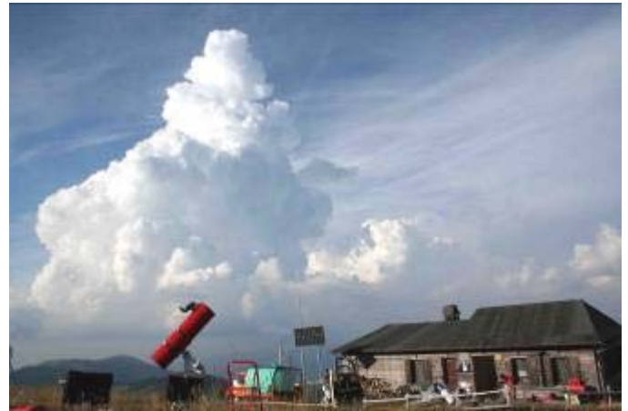
Sviluppo dei temporali in pianura visti dalla vetta

Dall'alba di sabato, invece, il Sole ha fatto capolino tra le nubi residue e fino al tramonto non ha mai abbandonato il campo di osservazione. L'affluenza è stata tale da saturare la disponibilità di posti del Rifugio già in mattinata, per cui è stata allestita una piccola tendopoli per assicurare un riparo notturno a tutti i partecipanti, già avvisati di dotarsi di tenda prima della loro partenza.