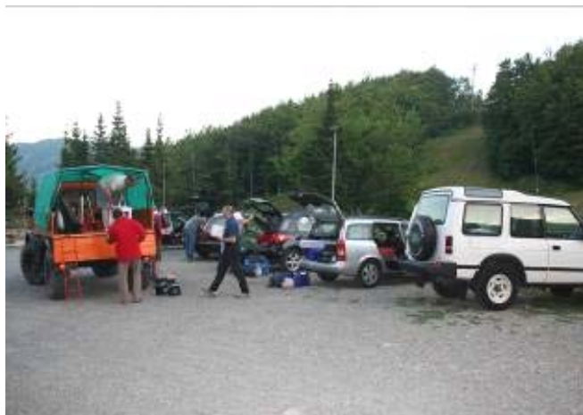
Carico effetti personali sui fuoristrada

L'edizione 2008 dell'iniziativa targata Gruppo Astrofili Lomellini è partita in salita e non solo per colmare i 1.600 Mt di dislivello che separano la più piatta pianura da una delle vette più alte della territorio Pavese: la funivia che collega Pian del Poggio alla vetta del Monte Chiappo, quest'anno non è stata messa in funzione.