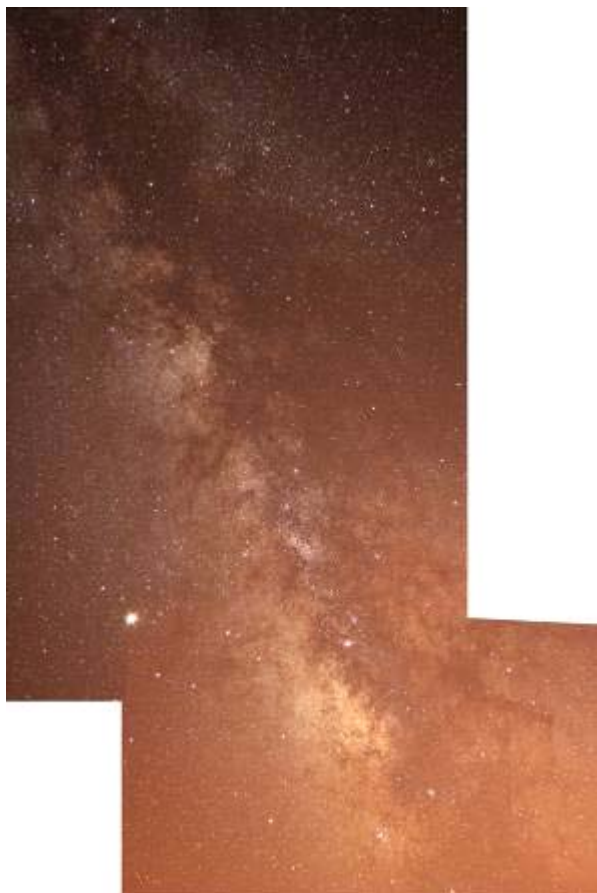
"Strisciata" della Via Lattea

Poco dopo il tramonto la volta celeste si è accesa di una miriade di stelle e la Via Lattea ha preso forma nella sua tipica "strisciata" da sud a nord.